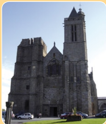
Cathédrale Saint-Samson de Dol-de-Bretagne (35)

C'est en 555 que Judual, roi de Bretagne, transforme le monastère en évêché. Après le sacre de Nominoë, souverain des Bretons, en 848, la ville devient la capitale religieuse de la Bretagne. Bientôt une cathédrale romane remplace l'église primitive, mais celle-ci fut détruite par les Vikings en 1014. Une seconde cathédrale romane est alors construite ; la consécration de cet édifice entrepris par la dynastie des Plantagenêts date de 1194.